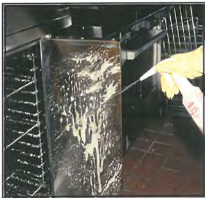
Easily applied with trigger foamer, Grill Brite clings for longer contact time.