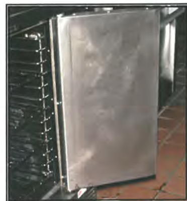
Cleans to like-new appearance in just minutes.