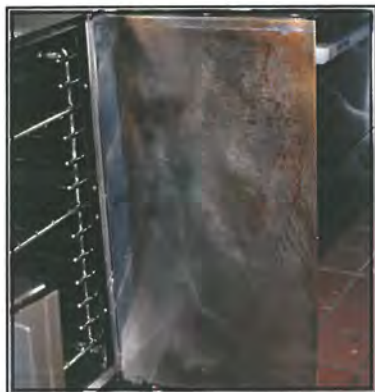
Verticle surfaces— no problem for Grill Brite

A demonstration of 651-ES Grill Brite's incredible cleaning power can easily be seen on this oven door.