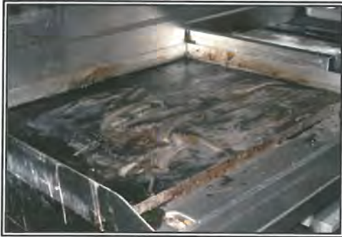
Apply Grill Brite to warm grill.