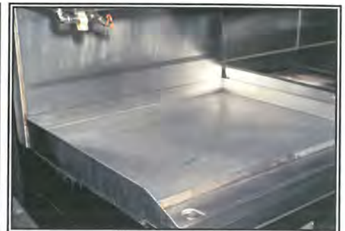
Then wipe away liquefied carbon and grease with damp cloth and rinse with water.