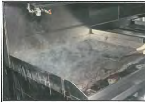
Work solution around grill surface with a flat spatula.